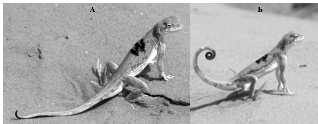
Рис. 2. Терморегуляционное поведение Ph. guttatus : А, Б — два варианта добровольного перегрева

ловки уходят в ажурную тень и, позднее, в густую тень у оснований кустов песчаной акации и белой полыни.